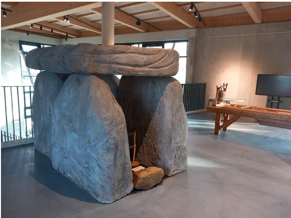
Reconstruction of a Megalith in original size

Megalithic Monuments are the oldest existing architecture of Europe, widespread over a lot of parts of Europe and more than 4.000 years of age. Beside the building meaning of megaliths on a local level Megaliths are ideal examples to show the formation process of a common Europe, how Europe was founded and grown up – by an overwhelming wide spread idea which led to initiatives and efforts to demonstrate the strength of a common sense and decisiveness. Today we can talk about 35.000 to 40.000 single sites as the outcome of this process and which remains from the Neolithic period, the time of the first farmers. They are spread over the majority of the European member states. Some lie hidden in rough terrain, others are well known excursion destinations and belongs to the UNESCO World Heritage sites.