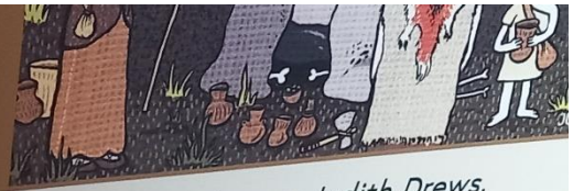
Bild rechts: Bestattungsszene an einem Großsteingrab, Zeichnung: Judith Drews.

stützung der AktivRegion Dithmarschen es Kreatives Europa geförderten Projektes RETOLD . Stand 2024